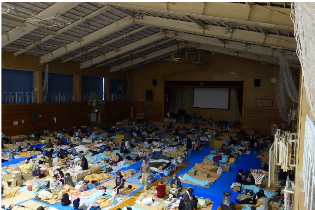
避難所となった豊野西小学校体育館（長野市豊野）