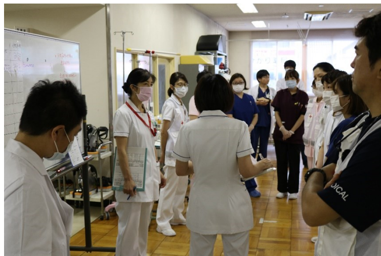
豊野病院からの収容に向けブリーフィングを行う(当院)