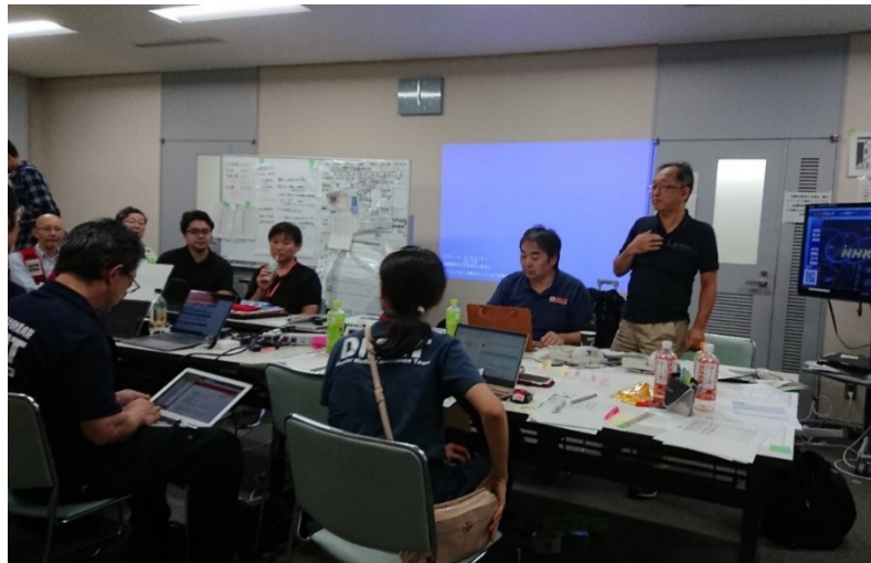
長野県庁内に設置された県DMA T活動調整本部（長野県庁）