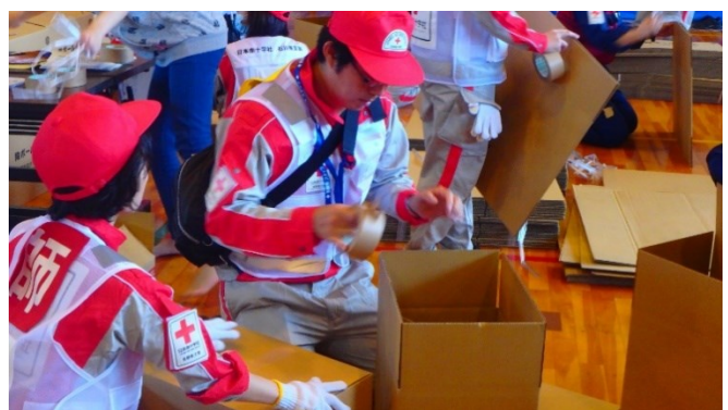
避難所で段ボールベッドを作成する救護班（長野市豊野）