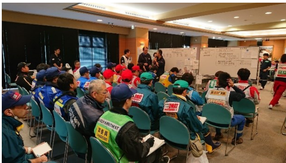
DMAT活動拠点本部へ参集した県内外のDMAT隊(当院)