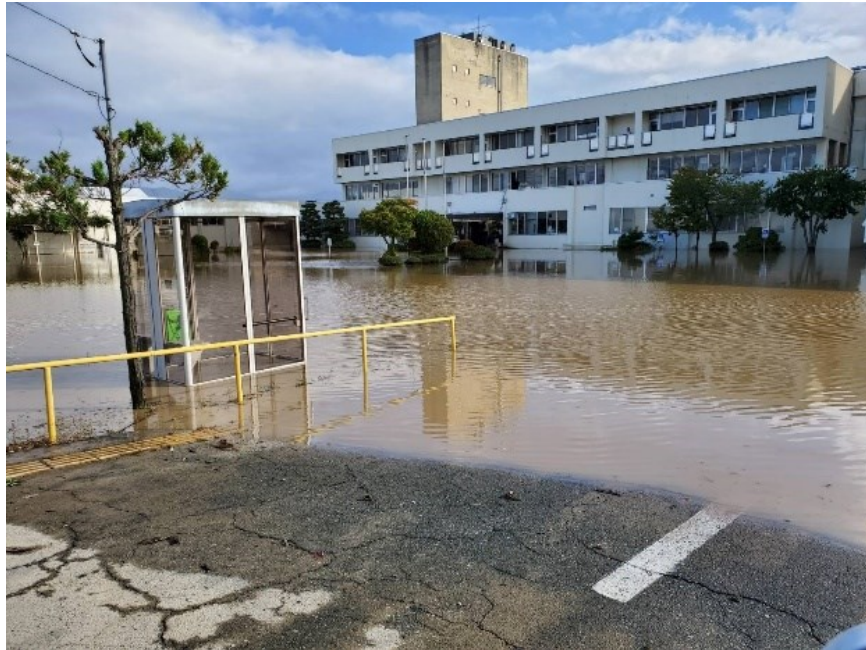
浸水した県リハ（長野市下駒沢）