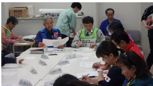
HANAの会議の様子（長野市保健所）