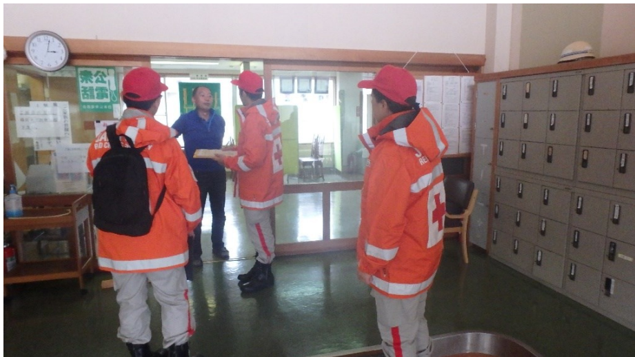
救護班が病院・クリニックなどのスクリーニングを実施（場所不明）