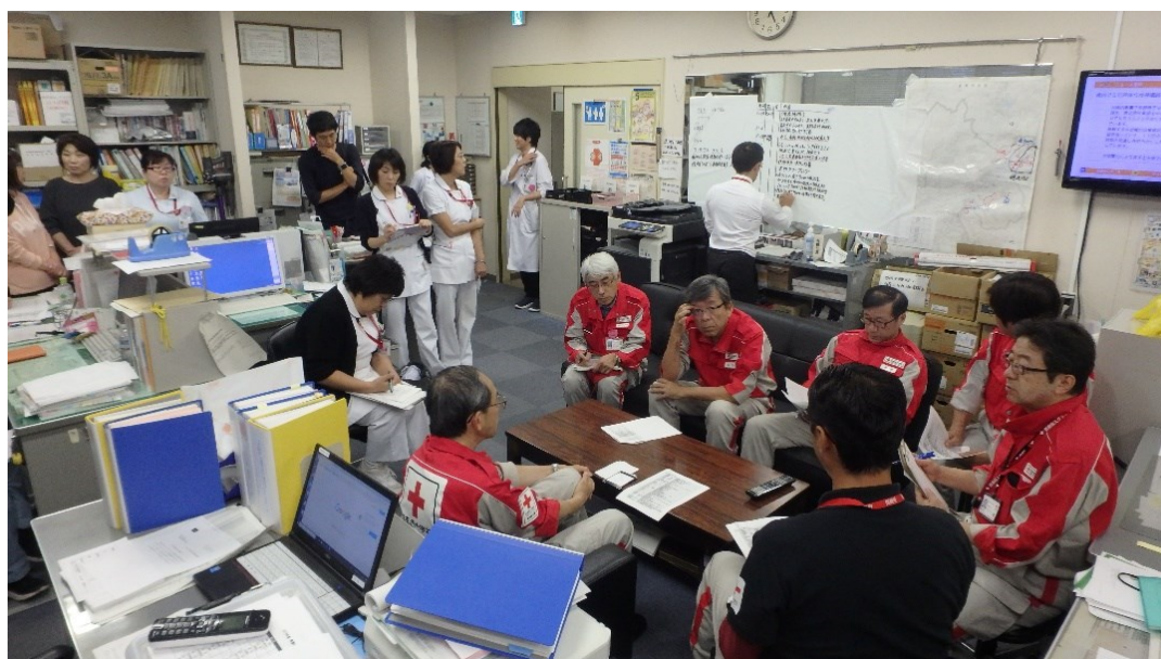
災害対策本部での会議の様子 (当院)