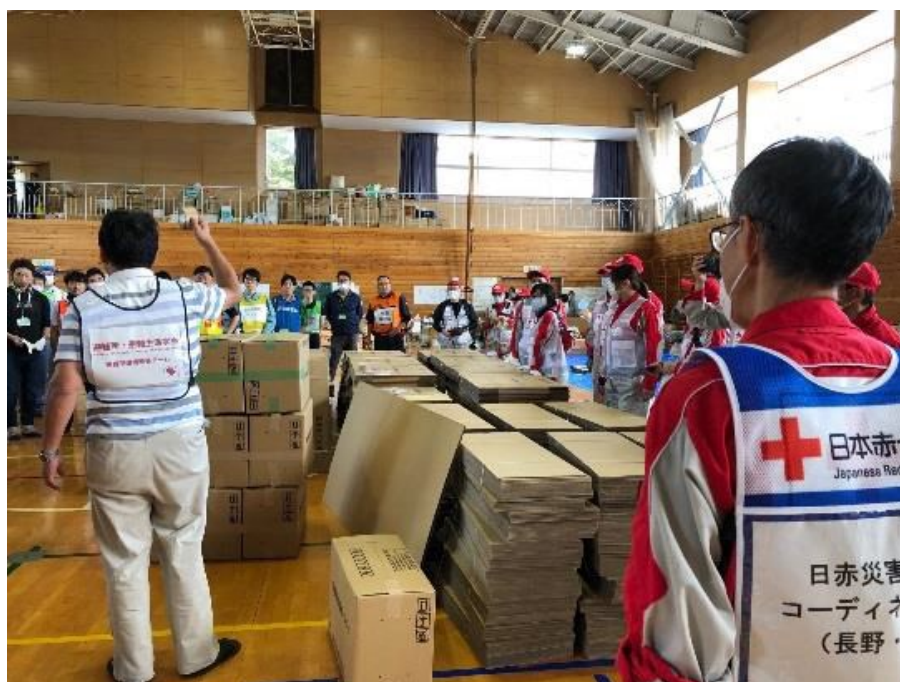
避難所において段ボールベッドの使用を説明する（長野市豊野）