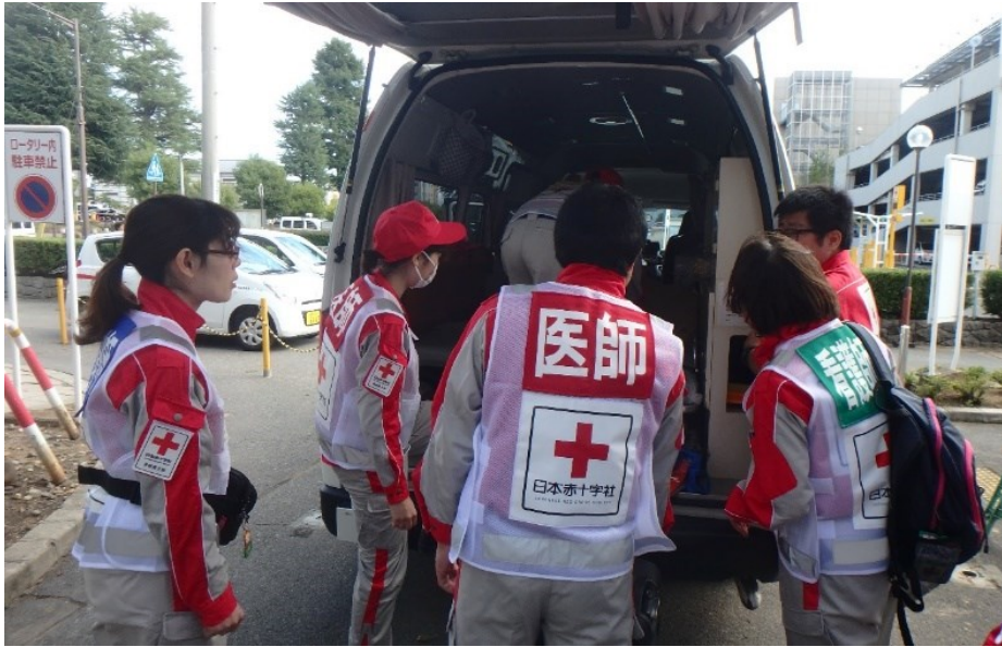
出動準備を行う救護班（当院）