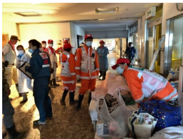
豊野病院で救護班とともに入所者を救助する(長野市豊野)