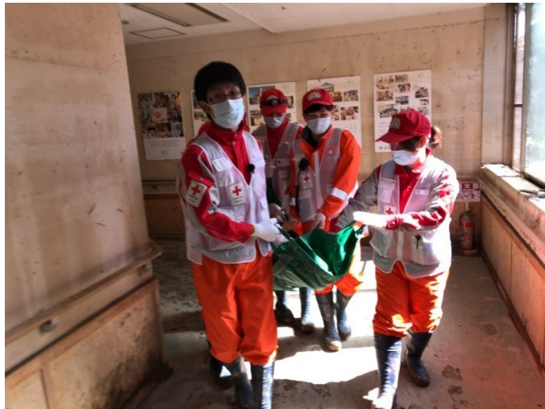
DMA T隊とともに浸水した豊野病院の入所者を搬送する（長野市豊野）