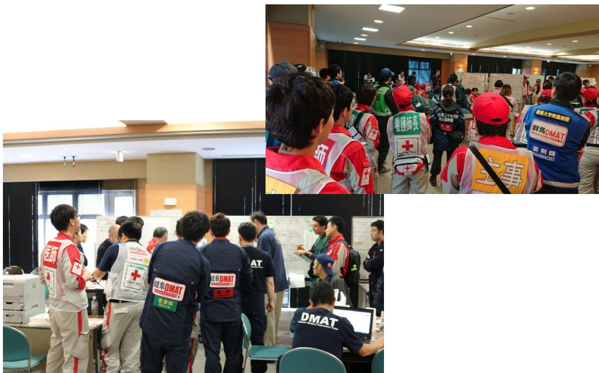
DMAT隊へミッションのブリーフィングを行う(当院)