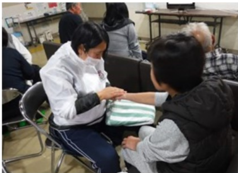
避難所でのこころのケア (場所不明)