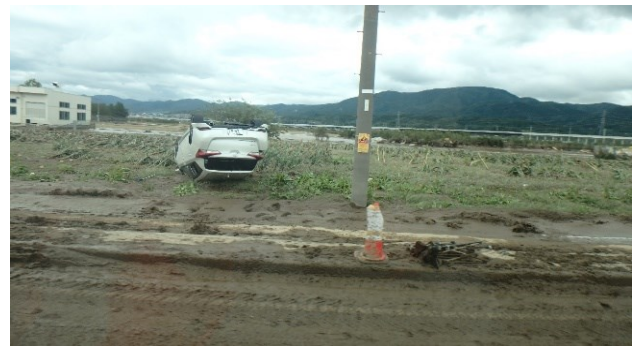
千曲川の堤防決壊によって流れ出した泥流と被害にあった車両（長野市穂保）