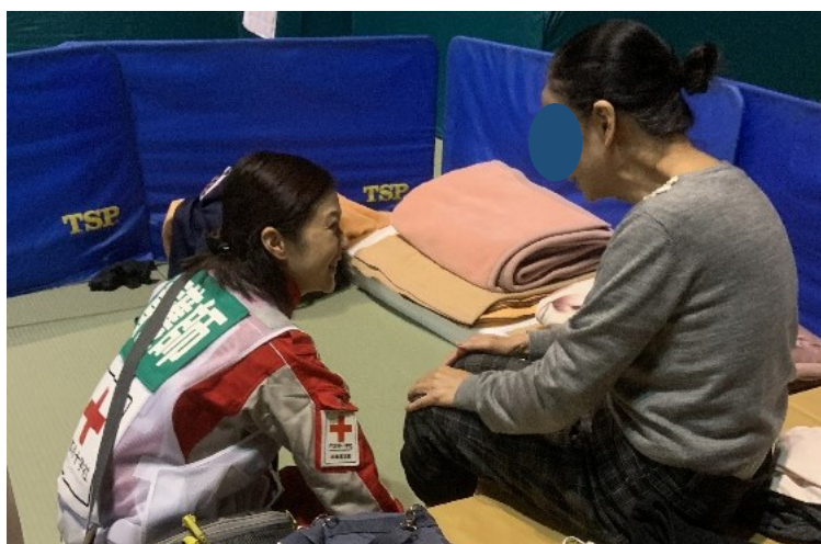
避難所でのこころのケア（場所不明）