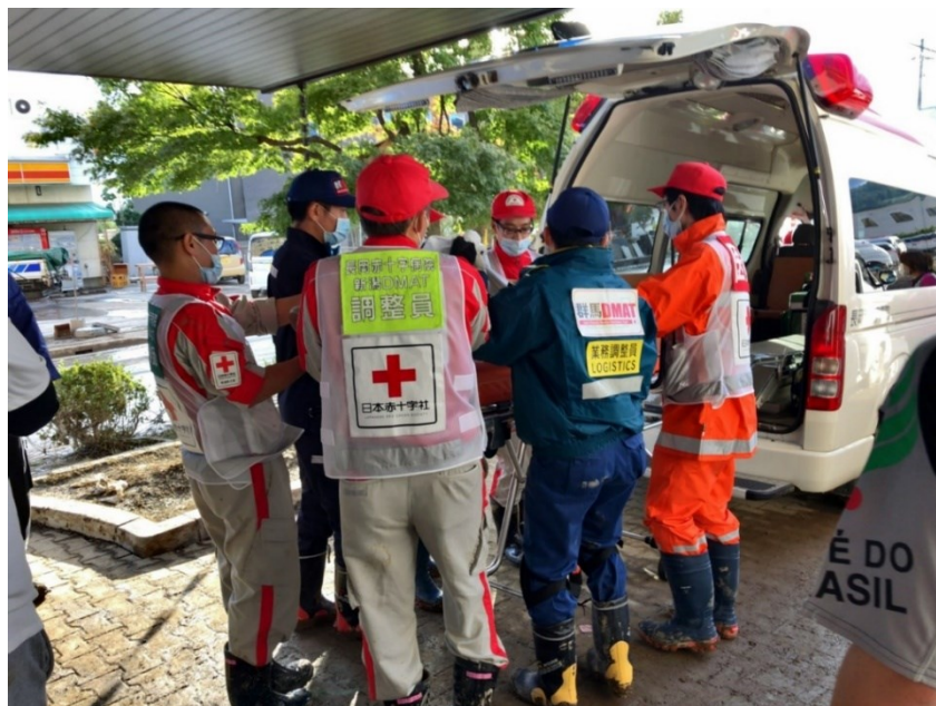
豊野病院から入所者を医療機関に搬送する(長野市豊野)

※ 受入状況には当院のDMA Tチーム及び県内外のロジスティックチーム、NPO、医療救護班を含む。