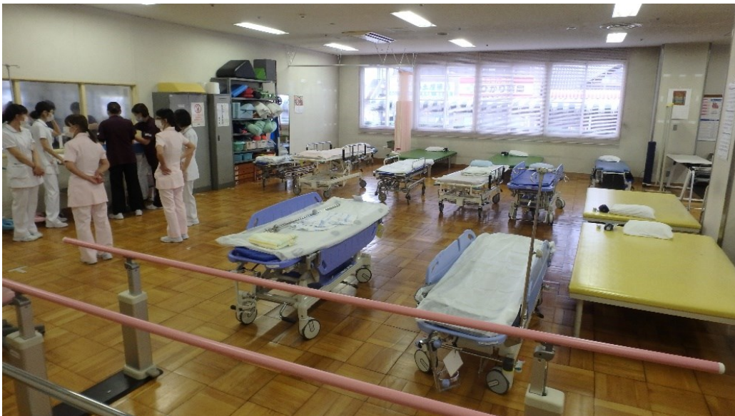
リハビリテーション室を豊野病院から搬送される患者さんの収容エリアとして開設(当院)