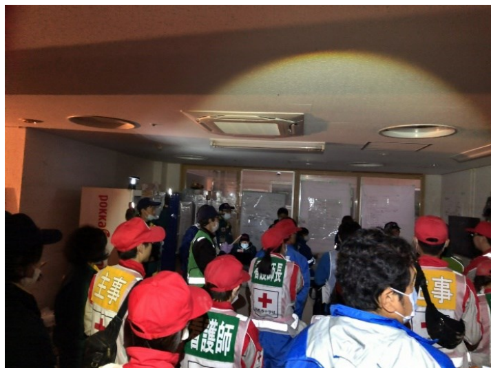
浸水した豊野病院でDMAT隊とともに状況を確認する（長野市豊野：支部提供写真）